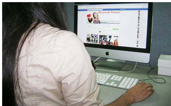
Img. 3: Corrupción y trata de menores mediante Internet