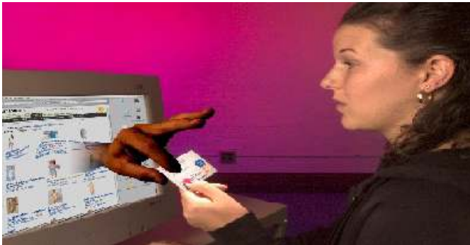
Img. 8 : Fraude y estafa informática

Las conductas relacionadas a la defraudación y estafa informática corresponden a todas las acciones delictivas derivadas de metodologías asociadas a los conceptos de Phishing, Vishing, Smishing, Pharming, Skimming/Clonning, etc; como a cualquier otra conducta orientada a modificar, alterar, ocultar y/o manipular datos, sistemas y programas informáticos con un fin delictivo.