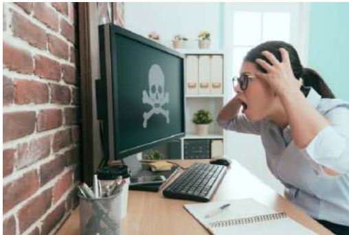
Img. 5 : Daño informático

Estas situaciones pueden causar computadoras lentas, borrado de archivos, aumento del tiempo de procesamiento, mensajes falsos y con contenido inapropiado asociados a dañar la imagen de una organización o persona, alteración o destrucción de programas, etc.