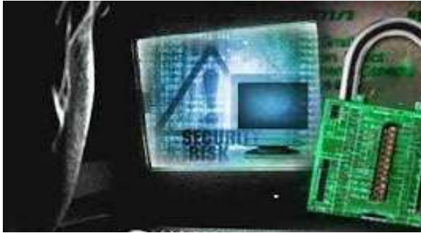
Img. 6 : Acceso indebido a un sistema o dato informático