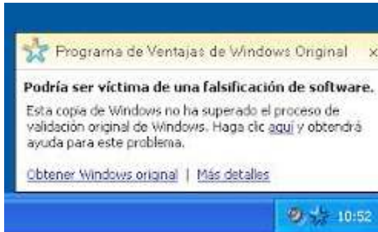
Img. 7 : Acceso indebido a un sistema o dato informático

Antes de la sanción de la ley 25.036 (1998) que modifica artículos de la ley 11.723, los delitos relacionados con la propiedad intelectual del software no estaban tipificados. Las copias parciales y totales no autorizadas (piratería), distribución sin consentimiento del autor y ventas ilegales por diferentes medios de Internet y medios magnéticos (CD/DVDs, pendrives, etc.) eran conductas no reguladas y carecían de la protección jurídica del software. La ley 25.036 sancionada en Octubre/1998 de Protección Jurídica del Software modifica algunos arts. de la ley 11.723 que protege los Derechos de Autor de obras científicas, literarias, artísticas, comprendiendo escritos de toda naturaleza entre ellos los programas de computación, la compilación de datos u otros materiales sea cual fuere el procedimiento de reproducción.