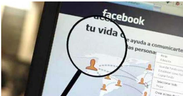
Img. 4 : Datos Personales

(Ley 25.326 de Protección de Datos Personales)