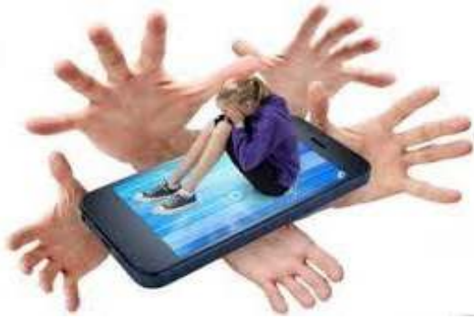
Img. 9 : Hostigamientos y otros delitos informáticos

Estos tipos de delitos también pueden ser realizados mediante el uso de los servicios de Internet como ser a través de las redes sociales (facebook, twitter, instagram, etc.), publicaciones en páginas web, correos electrónicos, mensajería (whatsapp, skype, Line, Chaton, etc.) o mediante el uso de cualquier dispositivo electrónico.