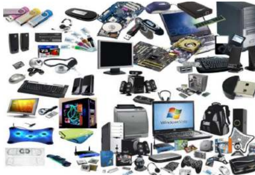
Img. 10 : Evidencia digital

Su recolección, preservación y presentación involucra una serie de procedimientos a cumplir en tiempo y forma, a fin de mantener la integridad, autenticidad, confiabilidad y validez legal de la misma.