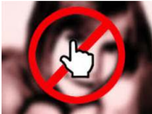
Img. 2: Pornografía infantil

Páginas de Internet, redes peer to peer, redes sociales, mensajería y uso de la Deep Web son medios que están al alcance de todos y con este tipo de contenido.